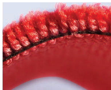
Tapis 100% PET